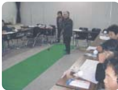
介護者による交流会