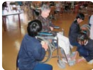
車椅子をみかく東小児童

川上保健センターで介護者教室をこのほど開催し、市の運動指導員による腰痛体操やスカットボールを。また、くす玉づくりなどの手芸をして交流を深めました。