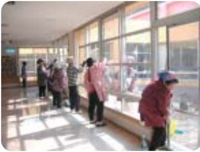
窓ふきをするあじさいの会の会員

この日は、あじさいの会の会員約六十人と、有漢東小児童会十五人の参加により、施設内の窓ふきや網戸の掃除などをしました。また、児童は入所者との会話を楽しみながら車椅子の掃除をしました。入所者は、きれいになった車椅子に「毎日使う物だし、きれいにしてもらってありがたい」と感謝しておられました。