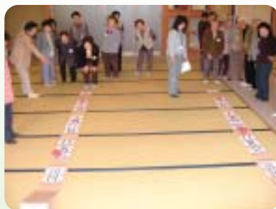
ルールゲームを楽しむ参加者

参加された方は、「毎月喜んで参加させてもらっています。同年代の方と交流ができるので一日楽しく過ごしています。また、お弁当に季節のものが取り入れてあり美味しかったです」と話されています。