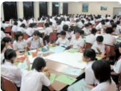
写真は昨年の事後研修会

夏のボランティア体験事業はボランティアの活動体験を通じて、社会福祉についての理解を深めると共に、ボランティア活動に積極的に参加する機会を提供することを目的としています。