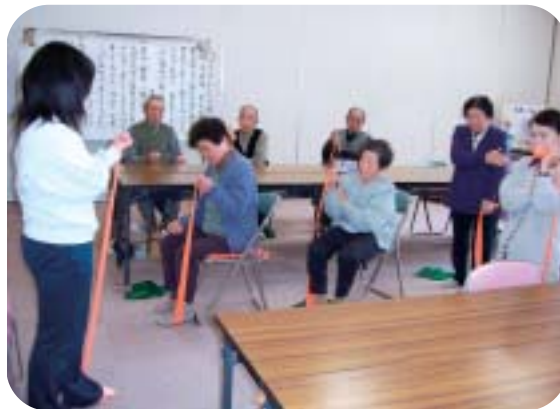
生きがい活動支援のようす