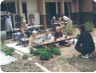
中庭からのお花見会