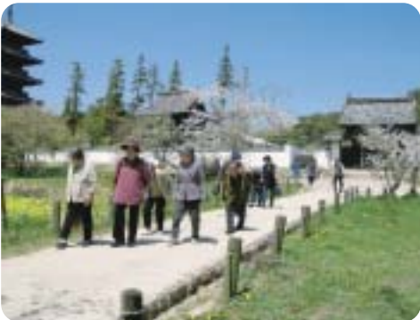
吉備路を散策する参加者

また、特産品などお土産の品定めも楽しみの一つで、仲間同士の会話も弾み楽しいひとときを過ごしました。