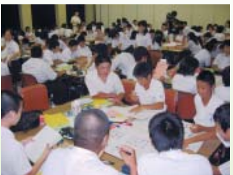
昨年の事後研修会の様子

七月上旬に、事後研修会を八月後半に実施する予定です。 夏のボランティア体験事業はボランティアの活動体験を通じて、社会福祉について理解を深めると共に、ボランティア活動に積極的に参加する機会を提供することを目的としています。 ▽対象：市内へ在住又は通学している中学生・高校生・大学生 ▽内容：市内の施設及び地域のボランティアの体験活動 ▽問い合わせ：社会福祉協議会本所・各支所