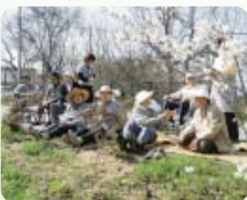
ささゆり苑周辺でのお花見会