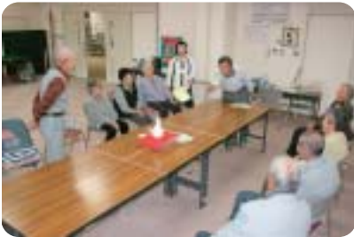
投扇を楽しむ利用者

利用者は「なかなか思うようにいかないが、的に当たったら気持ちがいい。皆さんと一緒に楽しい時間を過ごすの