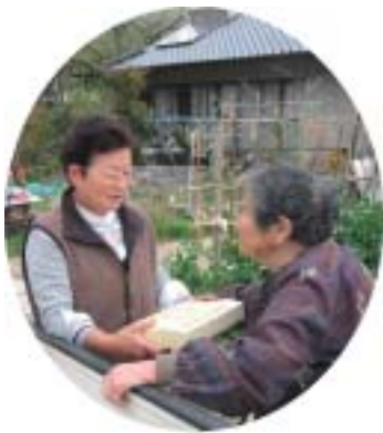
お弁当を配達するボランティア会員

これは、市から食の自立支援事業の委託を受けて実施するもので、約七十人の希望者に、ボランティアあじさいの会会員が、八つの地区グループに分かれ、声掛けと安否確認を兼ねて配食ボランティア活動を行っています。