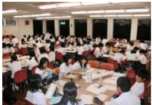
事後研修会で意見交換