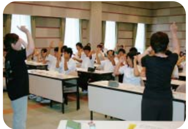
手話を指導する手話ボランティアの会の会員

出前講座に関する問い合わせは、高梁市社会福祉協議会地域福祉課又は各支所までご連絡下さい。