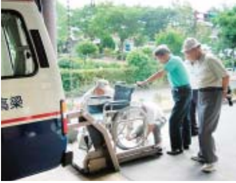
車椅子をリフトに固定する会員

高梁市福祉運転ボランティアの会は八月四日、平成二十年度の総会を高梁総合福祉センターで開催し、会員十七人の参加がありました。平成十九年度の事業報告及び平成二十年度の活動について協議した後、リフト車輻の昇降方法や車椅子の固定の仕方について研修を行いました。またこの日は、安全に移送サービスの提供ができるようにと、県運転免許センターで動作の正確さなどを検査する筆記方式のペーパー検査と適度な精神緊張