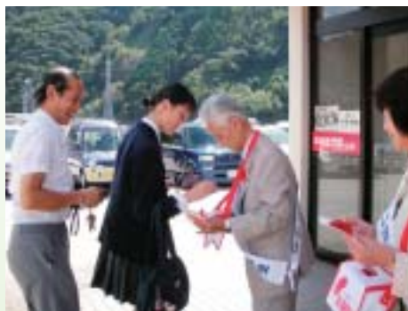
写真は昨年の街頭募金の様子