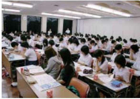
事前研修会の様子

高梁市社会福祉協議会では、ボランティア活動を通して社会福祉について理解を深めると共に、ボランティア活動に積極的に参加することが出来る環境づくりを行うため、市内在住及び市内へ通学している生徒、学生を対象に夏のボランティア体験事業を実施しました。