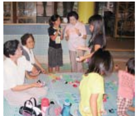
交流を深める老人クラブ会員と参加者