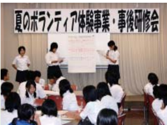
グループごとに発表する生徒

また、貴重な体験の場を提供いただいた受入施設の方とボランティア団体の方からは、生徒達への感想と事業に対する助言をいただき今年の夏のボランティア体験事業を終了しました。