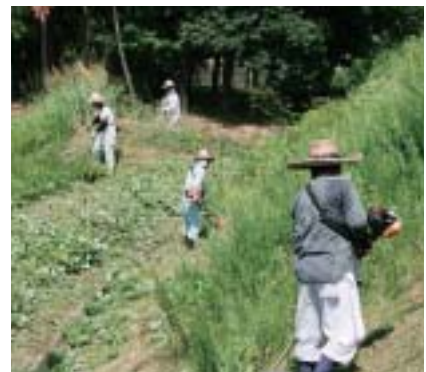
草刈りをする会員

高梁地区 TEL 22-7243 川上地区 TEL 48-9770 有漢地区 TEL 57-3218 備中地区 TEL 45-3131 成羽地区 TEL 42-2005