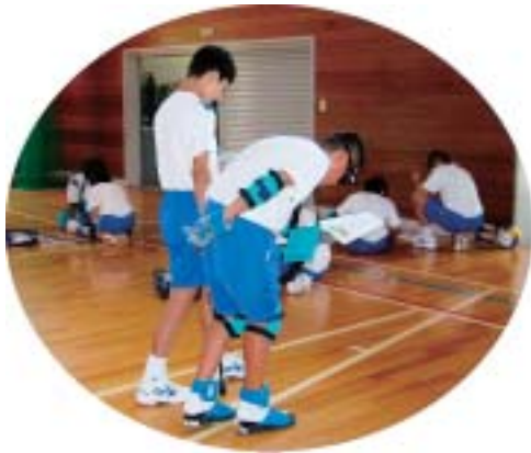
疑似体験をする川上中学校の生徒

これは高齢者や障害者の身体や心の変化を理解し、思いやりの心を身につけてもらうことを目的としており、このほど川上中学校で高齢者の疑似体験を、また岡山県学校保健会高等学校備北ブロック生徒保健委員研修会では高齢者の疑似体験と高梁市手話ボランティアの会にご協力をいただき手話体験を行いました。