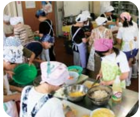
高齢者栄養改善料理教室で

のがうれしいです。積極的にボランティア活動に取り組んでもらいたい」と話されました。