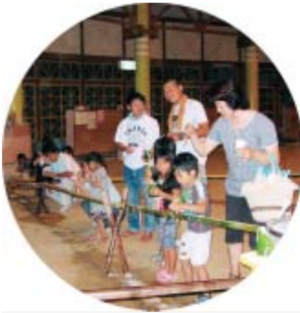
そうめん流しを楽しむ参加者

川上地域老人クラブは、核家族が増え、子供と高齢者との交流が失われつつある中、昔の遊びを園児や保護者に伝承して情操を養うことを目的とした「子育て支援活動モデル事業」（県の補助事業）に取り組んでおり、八月一日、川上児童館で開催された川上幼稚園児と家族とのお