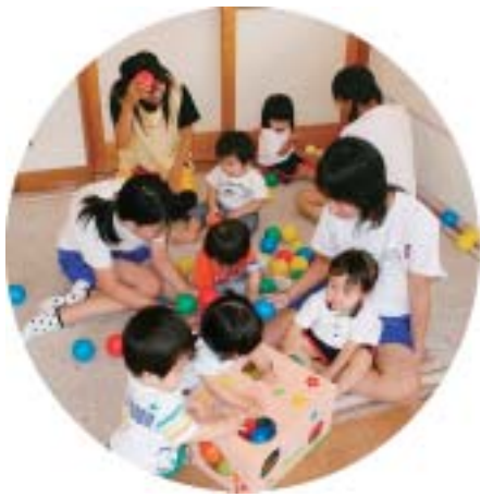
園児とふれあう生徒

ボランティア活動は、人間関係を大切にすることで「ありがとうと言われて嬉しかった」「社会の役に立てる」という充実感