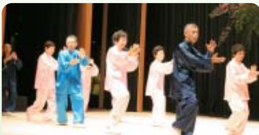
人気上昇中！太極拳

ねたきり高齢者の介護者に感謝状が 其々贈られました。更に、交通安全 対策協議会から無事故を祈って啓発 品が贈られました。 式典のあとは、舞踊や演奏、銭太 鼓、歌、太極拳などの演芸をみて初 秋の一日を楽しんでいただきました た。益々お元気で過ごして下さるこ とをお祈りします。