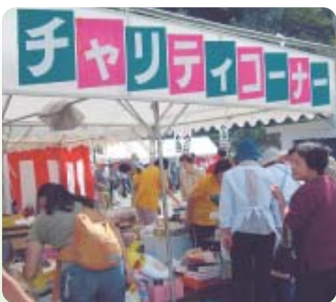
お客さんで賑わうようす

物品をお寄せいただいた方、とり まじめにご協力くださった福祉委員 さん、値つけをして下さったボラン ティアの方、買い求めてくださった 皆さまに感謝し、福祉活動の財源と して活用させていただきます。 ありがとうございました。