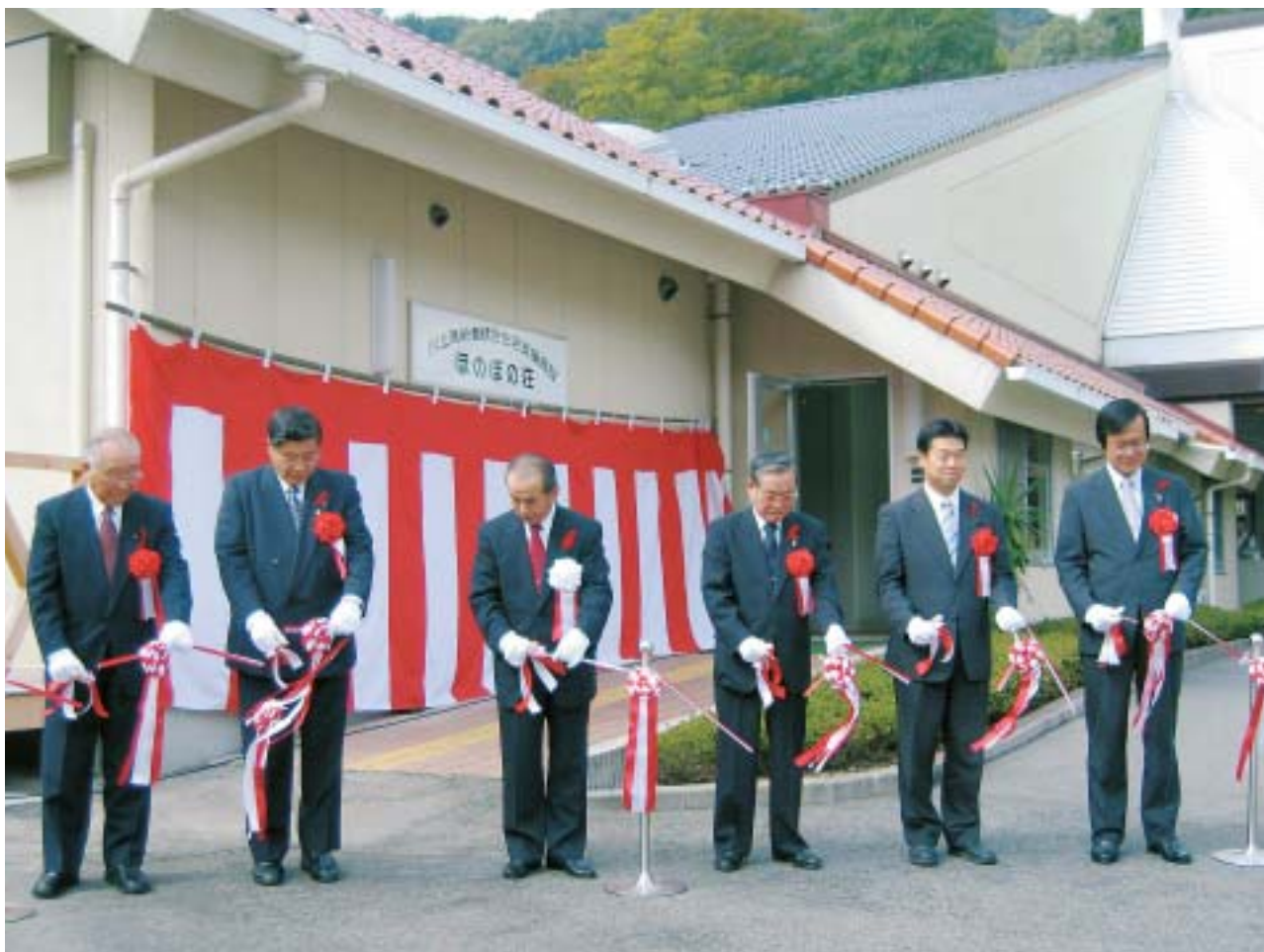
▲「ほのぼの荘」開所式テープカット

発行 社会福祉法人 高梁市社会福祉協議会 ・高梁総合福祉センター内 ・電話 (0866) 22-7243