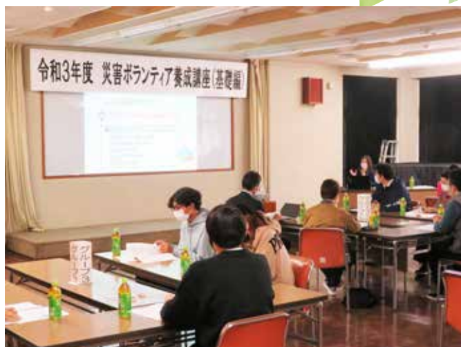
災害ボランティア養成講座（基礎編）の様子

また、災害時の状況に応じた難しい判断をゲームで体験できる「クロスロード」を演習していただき、参加者からは、「色々な方の意見を聞いて様々な気づきがあった」「災害ボランティア活動に対する壁が低くなった」といった声が聞かれ、大変有意義な講座となりました。