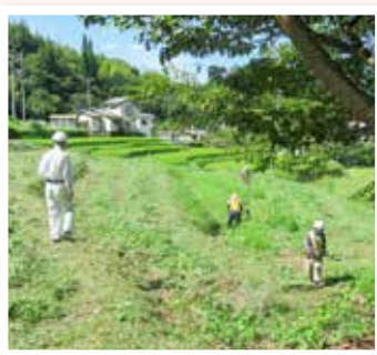
草刈り作業中の写真

剪定実技講習を中心に樹木の種類、整枝の基礎知識を学びます。(講習は無料ですが、ヘルメット、剪定バサミ、安全帯等が必要です。)