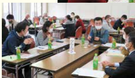
演習（クロスロード）をしている様子

今回の講座を【基礎編】とし、今後【応用編（ボランティアリーダー編）（ボランティアセンタースタッフ編）】を開催予定としています。災害に強いまちづくりを進めていくために引き続き地域の皆様のご協力をよろしくお願ひします。