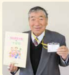
高梁市社会福祉協議会 福祉委員連絡協議会

なお、福祉委員を交代される場合は、お渡ししている福祉委員証をご返却いただきますようお願いします。