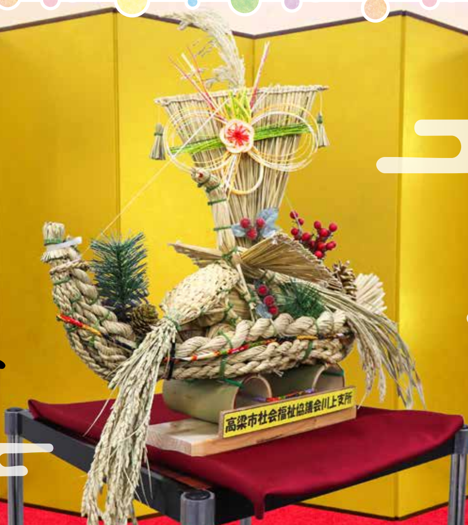
※写真は藁細工の宝船 わら