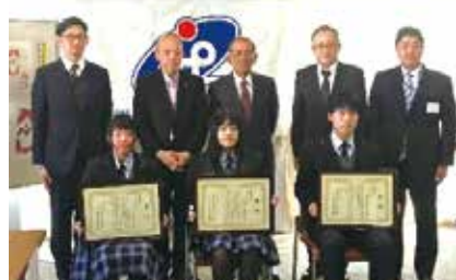
社会福祉法人 高梁市社会福祉協議会 イメージキャラクター表彰式