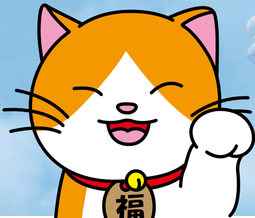
高梁市社会福祉協議会 イメージキャラクター「ふくにゃん」