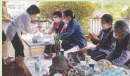
備中地区社会福祉協議会