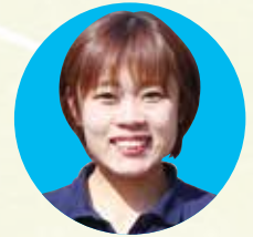
上杉コーディネーター