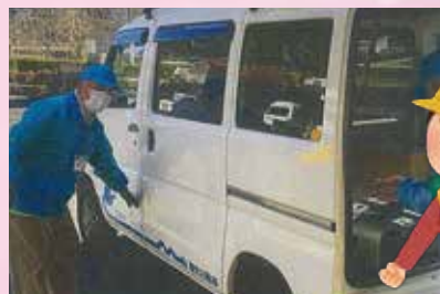
巨瀬防犯パトロール隊