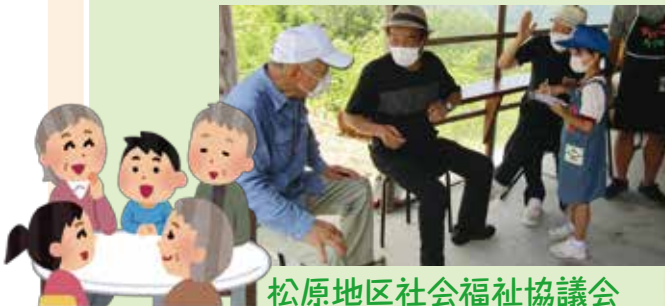
松原地区社会福祉協議会

社会的な孤立の防止を図るため、定期的に地域の方々の居場所づくりや、交流、情報交換などを行う見守り活動。コロナ禍ではありましたが、屋外で開催されるなど工夫をして開催されました。