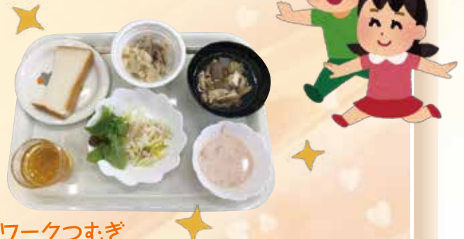
発達支援ネットワークつむぎ