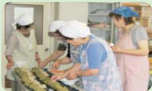
お弁当を作っているようす

今回は、六人の会員が粕餅と大豆入り煮込みご飯のお弁当を手作りし、地頭地区の八十五歳以上の老人世帯及び七十五歳以上の独居