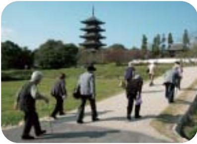
備中国分寺周辺を散策

また、十月二十八日は布賀地区の利用者が、十一月十一日には平川地区の利用者が参加された。秋のバス遠足を楽しみました。