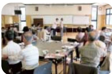
風ぐるまサロンのようす