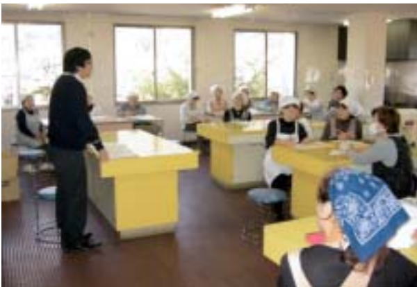
職員がサロン活動について説明いたします

他にも色々なサロン活動が実施されていますが、「うちでは、こんなユニークなサロン活動をやってみよう!」や「こんなサロン活動をする予定です」等の情報をお寄せください。皆さんの活動で高梁のまちが元気になるように盛り上げていきましょう。