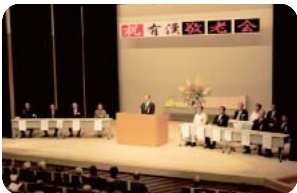
平成21年度 有漢町敬老会のようす

九月十三日、有漢町学習センターにおいて平成二十一年度有漢町敬老会が開催されました。