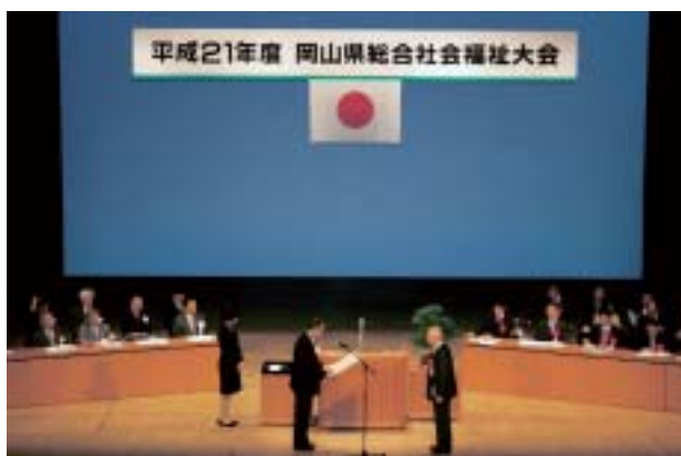
岡山県総合社会福祉大会のようす