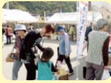
かわかみふるさと物産まつりでの募金活動のようす