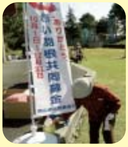
高齢者いきいきスポーツ大会での募金活動のようす

十月二十三日、川上地域老人クラブが、高齢者いきいきスポーツ大会の会場内で募金活動を行いました。