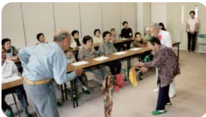
ロープ手品に挑戦している利用者たち

九月二十八日、巨瀬デイサービスセンターに手品ボランティアの訪問があり、利用者十二名は不思議な手品の世界に魅了されました。