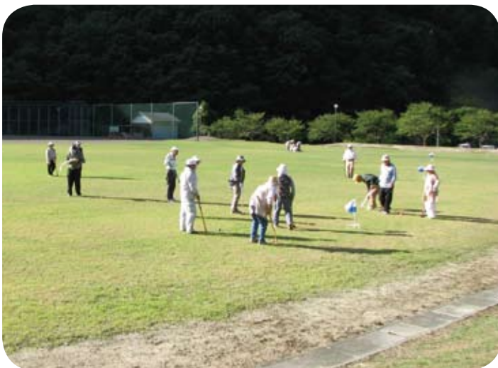
サロン活動でグラウンドゴルフを楽しみました

集まった方々は遠原地区の方々ばかりですが、久しぶりに会うことができ、今日一日とても楽しかったと喜んでいただいて、サロン活動を実施してよかったと思えました。今後も皆さんに喜んでもらえるサロン活動を続けていけたらと思っています。