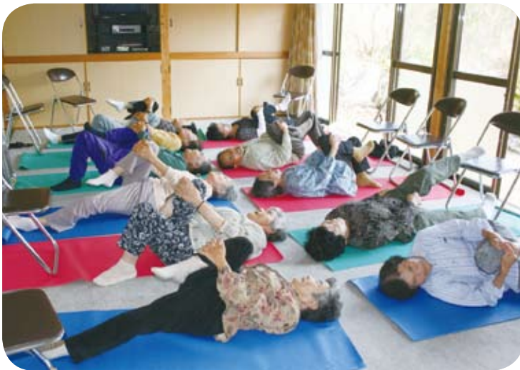
みんなで健康体操

これからも、地域に伝わる伝統行事の継承、また季節に合わせての会食会の実施など、気軽に参加のできる楽しいサロンにしていきたいと思っています。