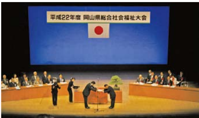
岡山県総合社会福祉大会のようす