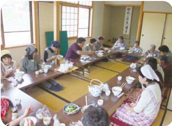
出来たてのうどんに舌鼓