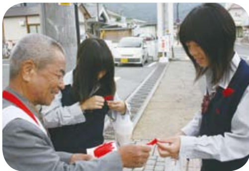
笑顔で募金していただきました

『じぶんの町を良くするしくみ』をキッチフレーズに募金活動を展開し、高梁のまちが笑顔いっぱいになるよう努力します。