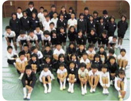
高梁市立有漢西小学校児童会

この度は、すばらしい賞をありがとうございます。これを励みに福祉ボランティア活動を充実させ、住みよい社会をつくっていきけるようがんばります。