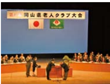
岡山県老人クラブ大会の様子