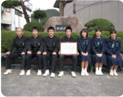
高梁市立備中学校生徒会

僕達の活動を評価していただいてうれしく思いました。これからもますます地域の力になれるような活動を充実させていきたいと思っています。