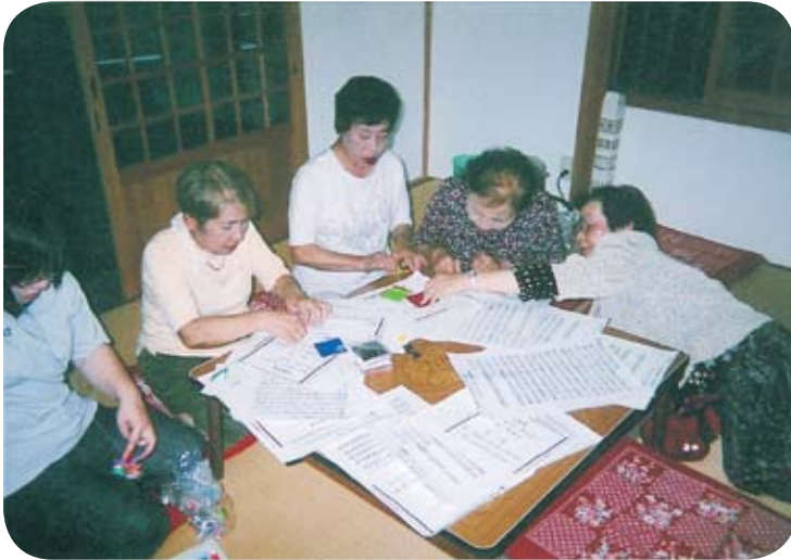
写経と千羽鶴を折っているようす