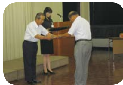
委嘱状交付式の様子

この班長の活躍によりシルバー人材センター会員の作業が円滑に行われています。任期は平成24年8月31日までの2年間です。