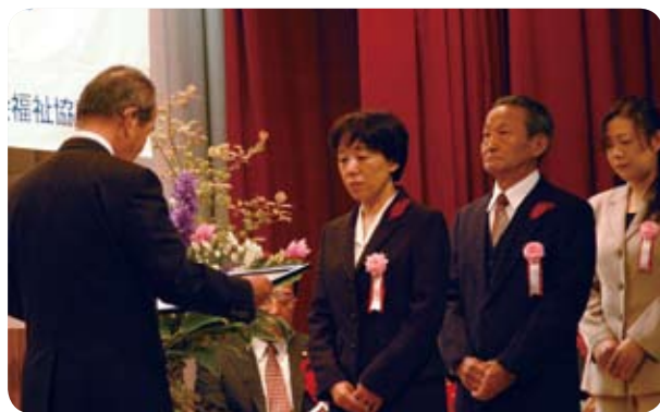
高梁市社会福祉協議会会長表彰のようす

今後とも利用者の方が安心して利用出来るよう会員全員で頑張りたいと思っております。