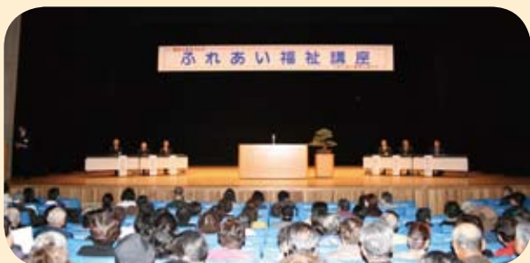
昨年のふれあい福祉講座の様子

※なお、当日は駐車場が大変混み合いますので、お越しの際は公共交通機関をご利用ください。