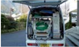
車内にはたくさんの機器を積んでいます

職員三人がチーム（看護職員一人、介護職員二人）となり、専用の浴槽を装備した訪問入浴車で訪問いたします。 介護保険認定者が、ご自宅のお部屋で入浴ができるサービスのことで 職員三人がチーム（看護職員一人、介護職員二人）となり、専用の浴槽を装備した訪問入浴車で訪問いたします。