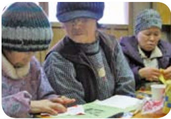
折り紙でバラの花を作っています

皆で集い、近況を報告しながら楽しく物を作ることで、安らぎと生きがいを感じながら、これからもサロン活動が続けて行けるよう頑張りたいと思います。