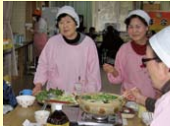
かわかみ療護園を訪問し、クリスマス料理やお正月料理を作り、入所者と交流