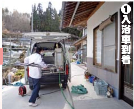
利用者のご自宅へ入浴車が伺います