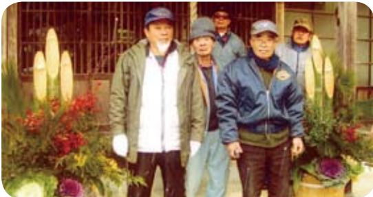
神社に奉納した門松

現在の会員は十八人で、季節の行事やグラウンドゴルフ大会などを計画し、地域の子供達と一緒に楽しめるよう活動を行っています。