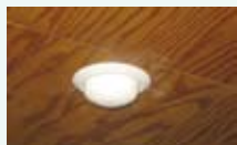
天井等の食堂や居室に設置したスプリンクラー

近年、認知症高齢者グループホームにおいて、火災が発生し、入居者の方々が亡くなられる悲痛な事例が起きております。この事例を受けて平成十九年六月に消防法施行令が一部改正され、小規模社会福祉施設に消防用設備を設置することが義務づけられました。