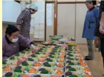
地域の80歳以上の高齢者宅へ手作りのおはぎ弁当を持って訪問