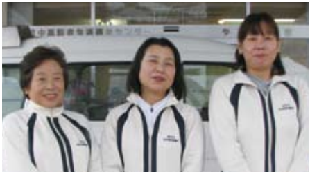
訪問入浴事業所 職員