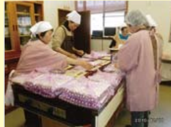
手作りのおせち料理を持って80歳以上の一人暮らし及び夫婦のみの世帯を訪問