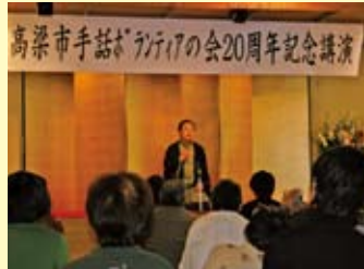
手話落語の講師を招き、他のボランティア団体や聴覚障害者と交流