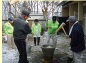
グループホームささゆり苑で、餅つきを実施し入居者の方と交流