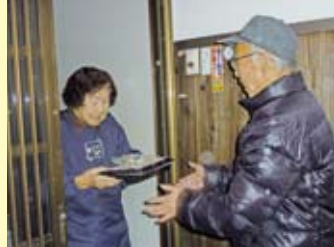
手作り弁当を持って75歳以上の一人暮らし及び高齢者世帯を訪問