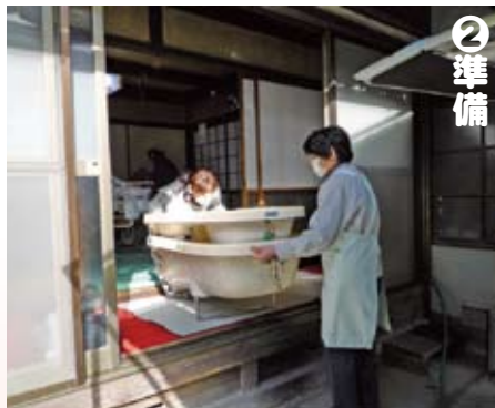
介護職員は入浴の準備を始めます。浴槽はベッドのあるお部屋に設置します。