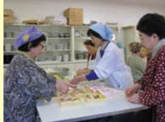
一人暮らし高齢者や障害者へ手作りのお寿司弁当を持って訪問