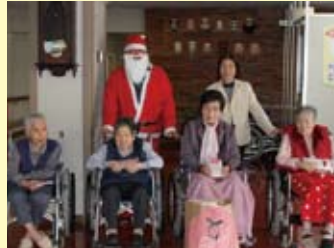
成羽町内の施設を訪問し、入所者の方と交流