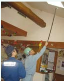
2月17日 施工業者と高梁市消防本部職員による完了検査を受けました

このたび、グループホームささゆり苑では、国からの交付金を受けて消防用設備として※スプリンクラーを設置し、火災時の緊急対応に備えました。