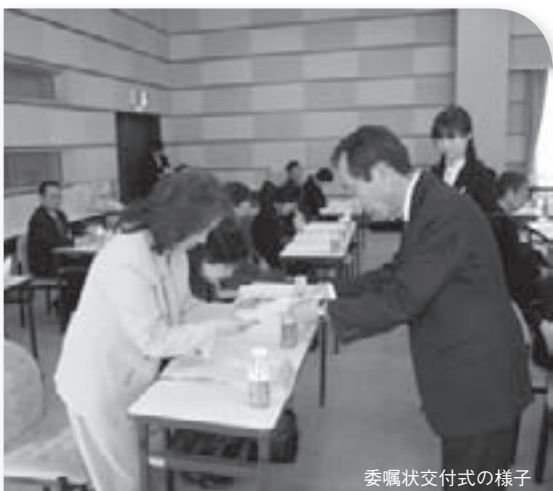
委嘱状交付式の様子