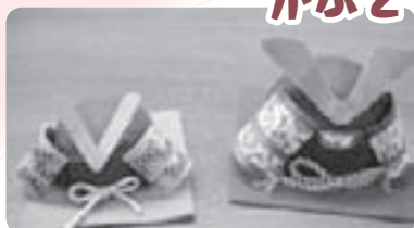
利用者が和紙や廃材などで端午の節句にかぶとを作りました