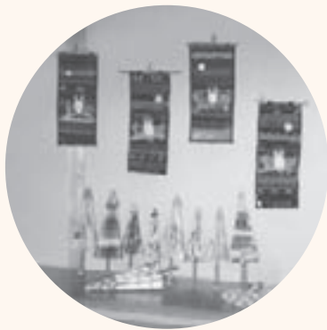
*タペストリーとは：絵や模様を布や織物で作って壁掛けにしたもの

月一回集会所に集まり、手芸や季節の行事、情報交換など、楽しく和気あいあいと過ごしています。二十三年度は、一人でも多くの人を誘って、また、より充実したサロン活動が出来たらと思っています。