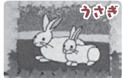
利用者がお花紙を丸めてうさぎを作りました