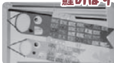
職員が大きな鯉のぼりを作り、利用者がたくさんの小さな鯉のぼりを貼りました