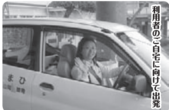
利用者のご自宅に向けて出発