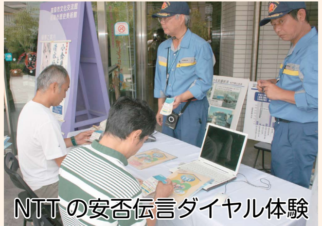
NTTの安否伝言ダイヤル体験