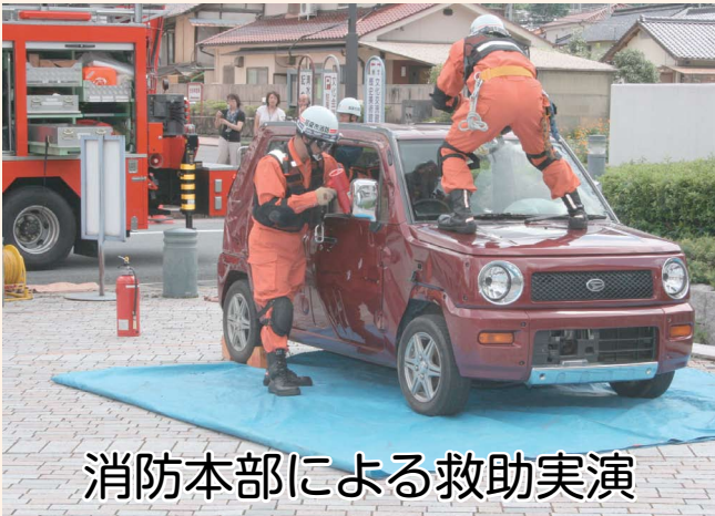
消防本部による救助実演

高梁市防災訓練では、消防本部による救助実演、安否伝言ダイヤル、非常食炊出訓練・試食などを実施しました。