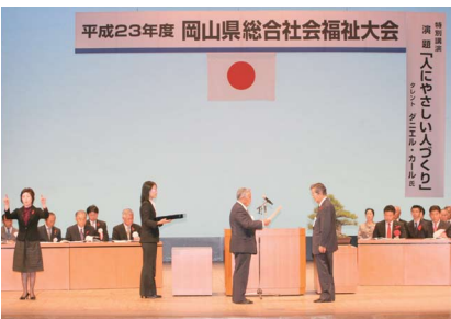
岡山県総合社会福祉大会の様子