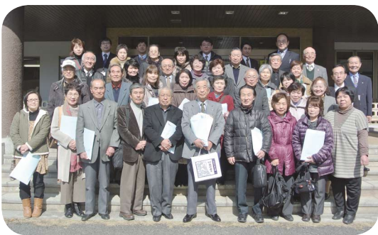
東温市重信地区民生委員児童委員協議会の皆さん

この日は、運転適性検査を行った後、高梁警察署から講師を迎え、安全運転や交通ルールについてお話をいただきました。参加者は「高齢者や障害者を迎えている身として、安全運転には特に気を配っているが、これからも、無事故無違反で安全運転に臨みます」と話されていました。