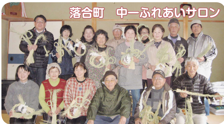
落合町 中一ふれあいサロン

楽しく作ることが出来ました。 また、1月14日にはどんど焼きをして、一年の無病息災、家内安全、学業成就を祈りました。