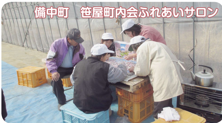
備中町 笹屋町内会ふれあいサロン

これから多世代 が気軽に交流して、 親睦を図り、支えあつ ていくことを目的に サロン活動を実施し ていきたいと思つて います。