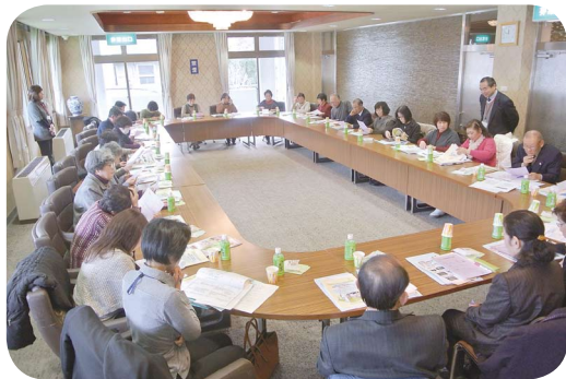
西条市社会福祉協議会小松・石根支部の皆さん

この収益金は、震災義援金として、岡山県共同募金会へ寄付させていただきました。多くの皆様のご協力ありがとうございました。