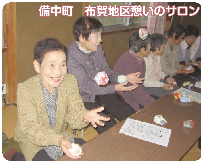
備中町 布賀地区憩いのサロン

備中町布賀地区で活動している布賀地区憩いのサロンは、高齢化が進む中、「ささえあい たすけあい」をモットーに、女性ボランティアが中心となり、高齢者の交流の場の提供や友愛訪問等を行っています。 10月24日には、14人が集まり茶話会を行い、折り紙細工の箱作りやお手玉遊びで昔を懐かしみ、最近巷で話題の脳トレクイズで頭の体操をし、近況報告や井戸端談義で楽しいひとときを過ごしました。また、この日は社協職員から社協の事業について紹介がありました。 11月21日には、21人が集まり、グラウンドゴルフで世代間交流を行い、終了後は、ぜんざいを食べながら和やかに親睦を深めました。 これからも、ふれあいサロンを通して、地域の交流の場として「輪」を大切に楽しく続けていきたいと思っています。