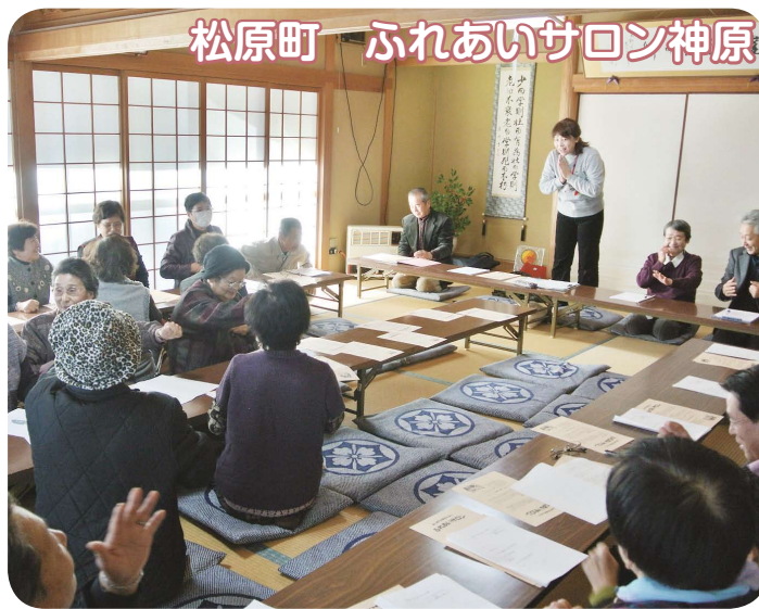
松原町 ふれあいサロン神原

地域の方からふれあいサロンを始めたいと声が上がったことがきっかけとなり、松原町神原の四地区から一名ずつ発起人が集まりふれあいサロンを立ち上げました。 11月26日の発足会には、社協職員から、ふれあいサロンについて説明があり、これからサロンでどんなことをしていきたいかを皆で話し合いました。グラウンドゴルフや健康教室をしたいなど、活発な意見が出ました。 サロンの名称を「ふれあいサロン神原」と名付け、この日に出た意見をもとに役員で計画を立てて、活動していきます。 ふれあいサロン神原では、心のつながりを大切に、支えあい助けあう安心の地域づくり推進のため、世代を越えた交流の場を開くことを約束事に掲げ活動を行っています。