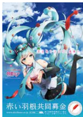
Illustration by 羽音 Crypton Future Media, INC. www.piapro.net piapro

高梁市共同募金委員会では、戸別募金、法人募金をはじめ、市内のイベント等で募金運動を行います。あなたのやさしさが、あなたの声かけが、あなたの行動が、地域を変えていくはじめの一步となりますので、本年度も皆さまからのあたたかいご支援ご協力をよろしくお願いいたします。