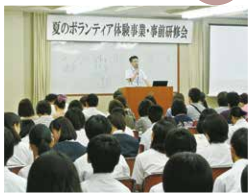
『福祉の仕事について』