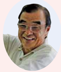
総社市福祉委員協議会