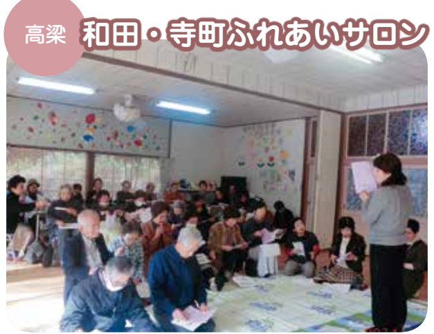
高梁 和田・寺町ふれあいサロン

私たちのサロンは気軽に集まって話や作業をすることで交流を深めることを目的に、昨年5月に立ち上げました。2ヶ月に1回、和田町の児童館をお借りして、民生委員さんや福祉委員さんの協力を得ながら実施しています。会員数は回を重ねるごとに増え現在42人です。 1回目となる5月は、お互いに案を出し合って行事計画を立てました。 7月は男性会員が準備された笹竹に一人一人が願いを込めて飾り付けをし、素敵な七夕飾りができました。 9月はハツサングズの方による寸劇を交えながらのとても楽しく分かり易い交通安全や振り込め詐欺の話が聞きました。 11月は社協職員の方から、社協事業や介護保険の利用等について話を聞きました。知らなかったことが多く、有意義な勉強会となりました。その後は、スプーンレースやボール運びなどの運動タイムです。みんな思わず本気になり、すっかり童心に戻りました。 これからも、会員みなで力を合わせて楽しいサロン活動を続けることができるように、一歩一歩前に進んでいきたいと思っています。