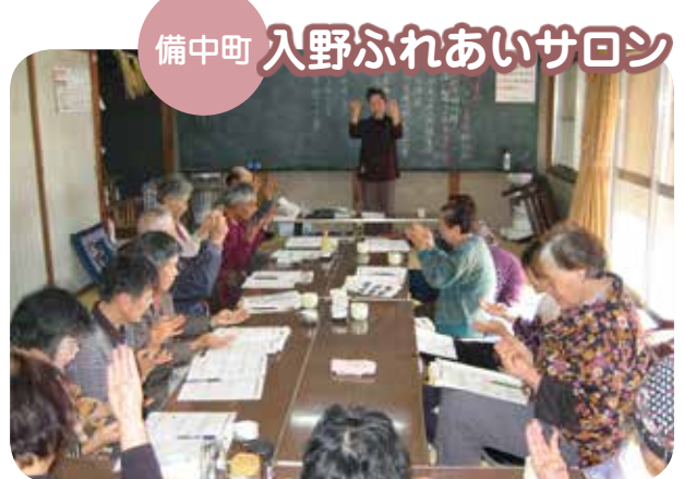
備中町 入野ふれあいサロン

私たちのサロンは、『笑いと花を咲かそう』をスローガンに活動を始めました。毎月、町内の集会所を清掃しながら花壇の整備・草取りをして、美しい花を咲かせています。 12月10日には、17人の会員が朝から集まり、手作りのうどんで昼食をとりました。午後からは頭の体操として、間違い探しや指体操、文字カードで単語づくりをしました。 会員みんなサロンを楽しみにしており、一年を通して計画盛りだくさんで、春は花見に始まり、夏の蕎麦蒔き、秋には案山子を作り、地域のイベントへ参加。冬には蕎麦打ちをしてみんなで味わい、家庭で眠っている品物を交換したり、また、手作りのエプロンを作成しています。 これからも、地域の親睦と絆を深め合い、共通の話題と実践活動などでふれあいに花を咲かせたいです。