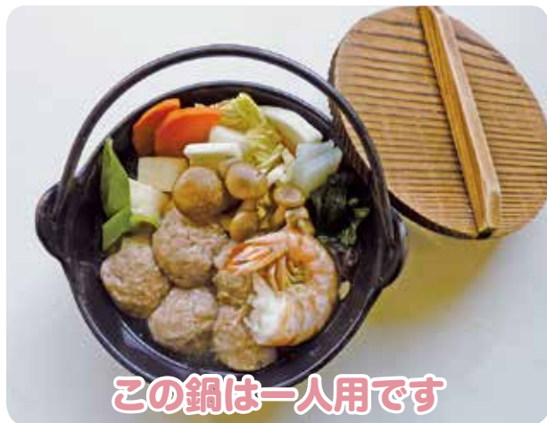
この鍋は一人用です