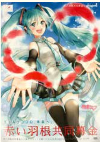
illustration by 羽音 Crypton Future Media,INC.www.piapro.net piapro

高梁市共同募金委員会では、多くの方々に「赤い羽根共同募金」に関心を持っていただくこと、また住民同士の支えあい活動を若い世代から盛り上げ、安心して暮らすことのできる地域を目指すことを目的に実施している寄付つき商品の取扱いをしています。皆さんのご協力をよろしくお願ひします。