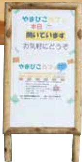
写真は松原地区社協が実施している「やまびこカフェ」。各地区の様子は4ページに掲載。