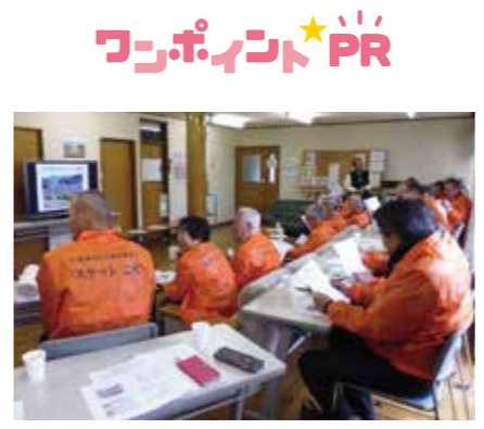
スケットこせ 巨瀬地区では屋外軽作業で困っている人をお助けする有償ボランティア活動も開始しました。