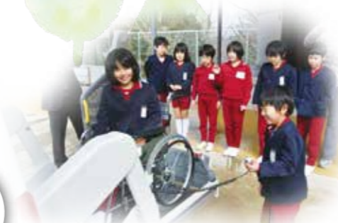
福祉車両操作体験