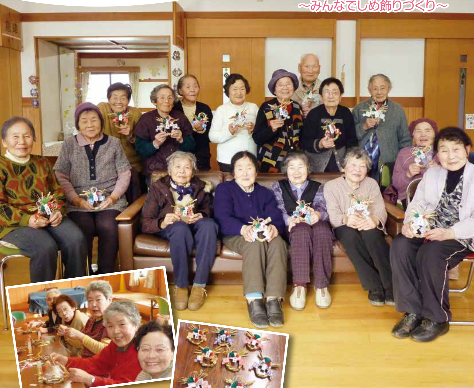
※完成したしめ飾りを手にみんなで記念撮影 (川上いきいき交流館)