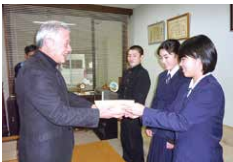
川上中学校生徒会の皆さま

川上中学校生徒会・川上小学校児童会より、赤い羽根共同募金が寄せられました。この募金は、文化祭などのイベントや登下校時、また、朝礼などの場を利用して集められたものです。ご協力ありがとうございました。