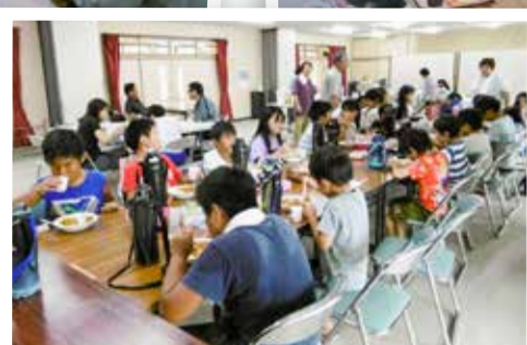
※この写真は昨年等の様子です

たりと、手間はかかりますが、それが来場者の喜びに繋がれば、私たちの喜びでもあります。この「カフェわ・わ」が一人でも多くの方の拠りどころになれるよう、これからも続けていきたいと思えます。