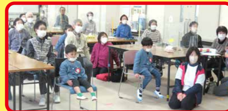
通いの場 (もくもく DAY)