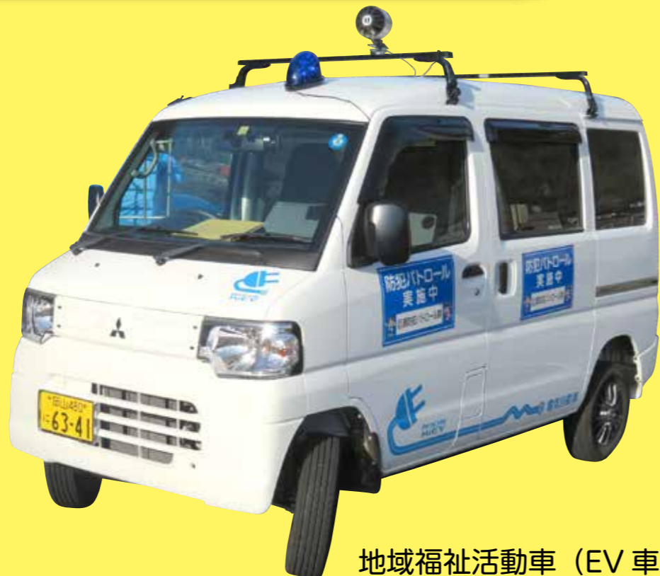
地域福祉活動車 (EV車)

巨瀬町には地域福祉活動車として、電気自動車 (EV車) があります。現在は、通いの場の送迎や防犯巡回活動に利用していますが、高齢者の足回り支援への利用も計画していきます。