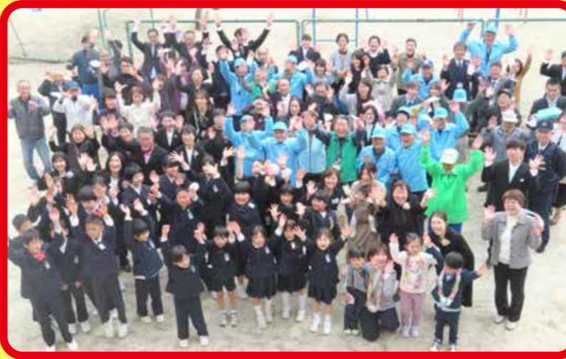
楽しい町 (地域主催の卒業式)